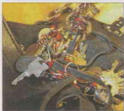
Rund 30 Schlüsseltaschen enthält die kleine Schlüsseltasche, die der Wachmann mitnimmt.

17 Funkstreifenreviere werden mit firmeneigenen Funkstreifenwagen abgefahren. Die Mitarbeiter kontrollieren, von Kunde zu Kunde fahrend, die Gebäude, achten auf Einbruchspuren, Diebstahl und Brandgefahren, sich unbefugt auf Privatgelände aufhaltende Personen, offene Fenster sowie sonstige Unregelmäßigkeiten – und alarmieren sofort die Polizei.